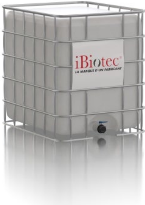
GRV konteyner 1000 L