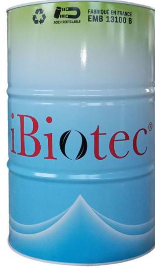
200 L varil